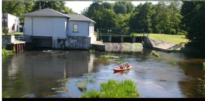
Na zdjęciu u góry pokazujemy stan wody rzeki Łupawy w połowie grudnia 2017; obok ten sam obrazek z okresu letniego. W całej gminie, we wszystkich miejscowościach nastąpiły lokalne podtopienia łąk, pól, posesji. System melioracyjny wymaga kapitalnego remontu.

Warto wspomnieć również, iż temat melioracji terenów gminy jest dla Samorządu niezwykle istotnym celem w latach kolejnych. W roku 2017 wykonano prace mające na celu odwodnienie miejscowości Wierzchocino, Stojcino, Kluki, Smołdzino, Gardna Wielka. Powyższe działania mają jednak charakter doraźny. System melioracyjny jest obecnie bardzo zaniedbany, ponieważ użytkownicy rowów melioracyjnych nie wywiązują się ze swoich zadań, często doprowadzają do spłylenia i wstrzymania przepływu wody, co skutkuje lokalnymi podtopieniami. Planujemy podjąć działania wymagające współpracy wszystkich zainteresowanych stron.