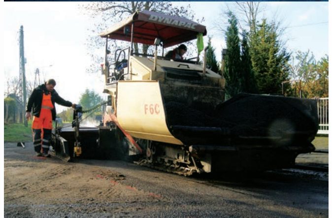
Prace przy remoncie drogi w Witkowie