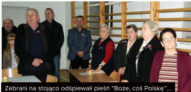
Zebrani na stojąco odśpiewali pieśń "Boże, coś Polskę"...