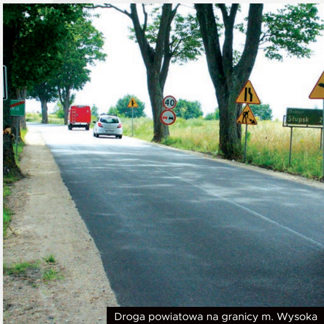
Droga powiatowa na granicy m. Wysoka

W uzgodnieniu z Radą Gminy udało się przeznaczyć na ten cel znaczną część wypracowanej nadwyżki, tj. ok. miliona złotych. W efekcie tego mamy obecnie w dobrym stanie drogę powiatową aż do Słupska.