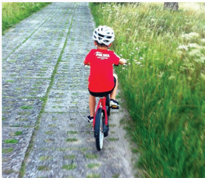
Budowa i remont ścieżek rowerowych zadanie na nowy rok.

Na przyszły rok planowane jest także podjęcie działań rozbudowy oświetlenia, w tym również na dwóch gminnych cmentarzach w Smołdzinie i Gardnie Wielkiej oraz punktowo w innych miejscach na terenie gminy.