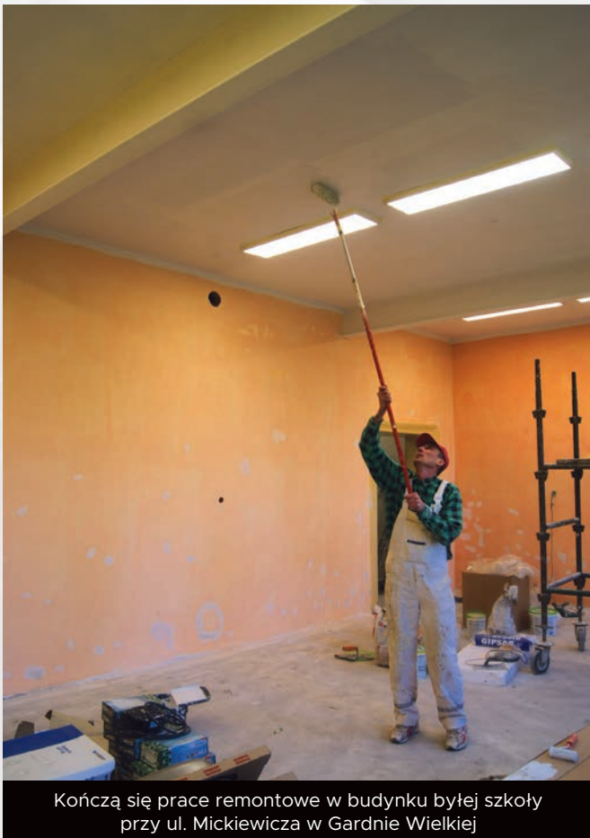
Kończą się prace remontowe w budynku byłej szkoły przy ul. Mickiewicza w Gardnie Wielkiej

Największe jednak przedsięwzięcia realizowane są w Zespole Szkolno – Przedszkolnym w Smołdzinie i Gardnie Wielkiej. W związku z przedłużającymi się procedurami przetargowymi (4 – krotnie ogłaszany przetarg) rozpoczęcie zaplanowanych prac było znacznie utrudnione. Ostatecznie udało się wyłonić wykonawcę, który obecnie wykonuje prace remontowe w części przeznaczony na przedszkole w budynku po byłej szkole w Gardnie Wielkiej. Prace obejmą również budowę placu zabaw dla dzieci.