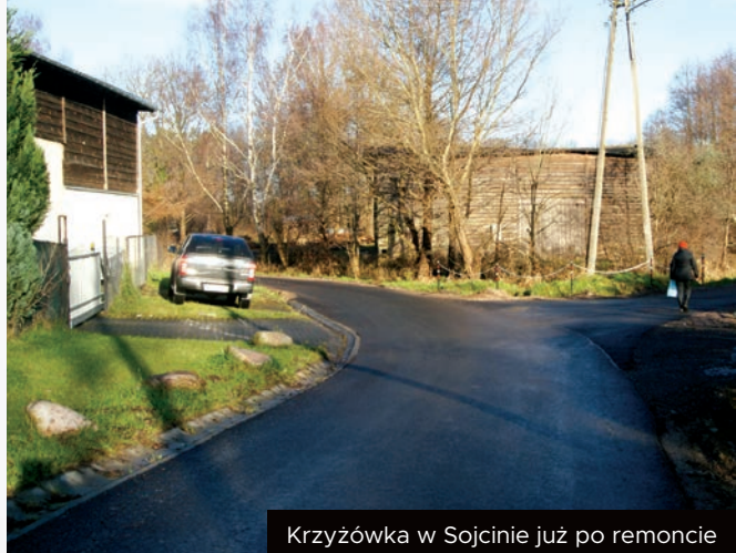
Krzyżówka w Sojcinie już po remoncie