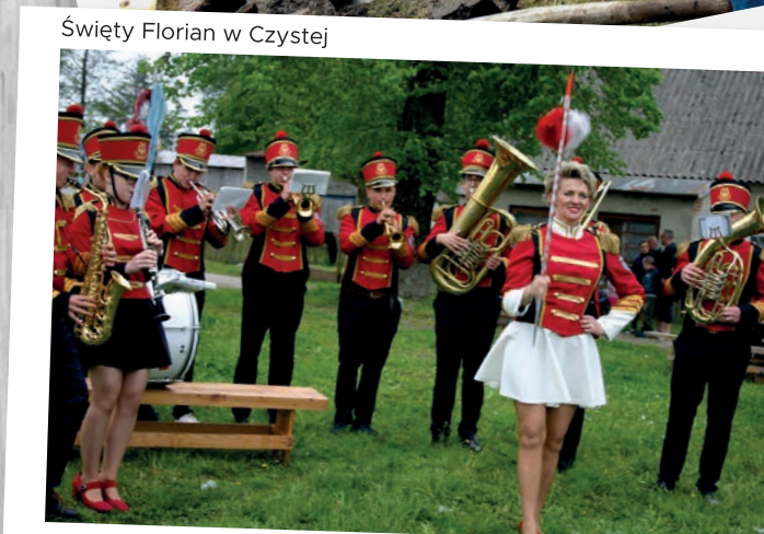
Święty Florian w Czystej