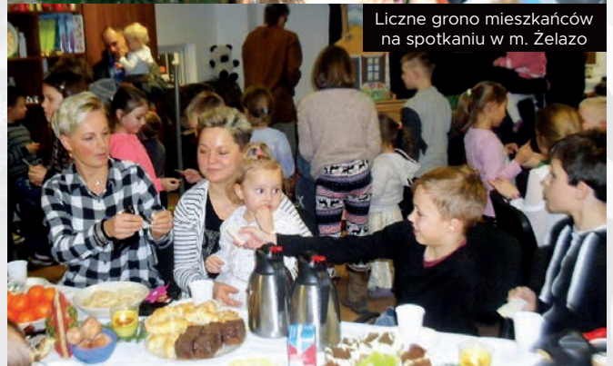
Liczne grono mieszkańców na spotkaniu w m. Żelazo