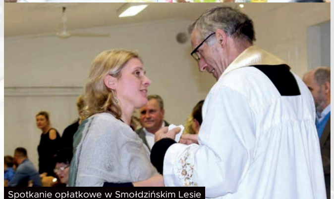
Spotkanie opłatkowe w Smołdzińskim Lesie