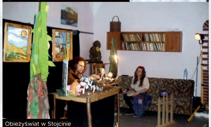
Obieżyświat w Stojcino