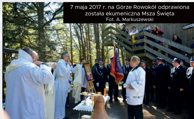
7 maja 2017 r. na Górze Rowokół odprawiona została ekumeniczna Msza Święta

Od kilku tygodni prowadzę rozmowy z nowym Ministrem Ochrony Środowiska na temat spotkania w Warszawie. Myślę, że do takiego dojdzie w ciągu kilku tygodni. Będę chciał przypomnieć o składanych Gminie obietnicach, pomocy w zakresie uruchomienia specjalnego programu przez Narodowy Fundusz Środowiska czy też w kwestii pomniejszenia wkładu własnego Gminy do inwestycji proekologicznych. Mam nadzieję, że dalej będę otrzymywał pomoc z WFOŚ chociażby przy wspomnianych wcześniej projektach fotowoltaiki czy wymiany pieców w jednostkach gminnych. Zamierzam również wywiązać się z obietnicy jaką składałem mieszkańcom w sprawie utworzenia Funduszu Sołectkiego. Zawsze byłem jego propagatorem, jednak niestety do tej pory nie było nas na to stać. Już na sesji w marcu przedstawię projekt uchwały w tej sprawie. Na ten rok są przewidziane jeszcze dwie inwestycje remontowe tj. kontynuowanie remontu świetlicy wiejskiej w Wierzhocinie oraz rozpoczęcie prac remontowych świetlicy w miejscowości Łokciowe. Chciałbym jeszcze poinformować mieszkańców, na jakim etapie jest kwestia odbudowy kaplicy na Rowokole.