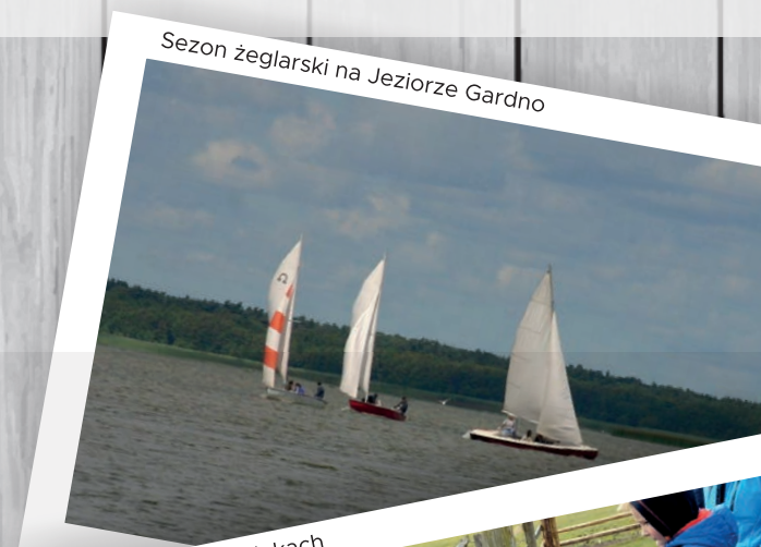
Sezon żeglarski na Jeziorze Gardno