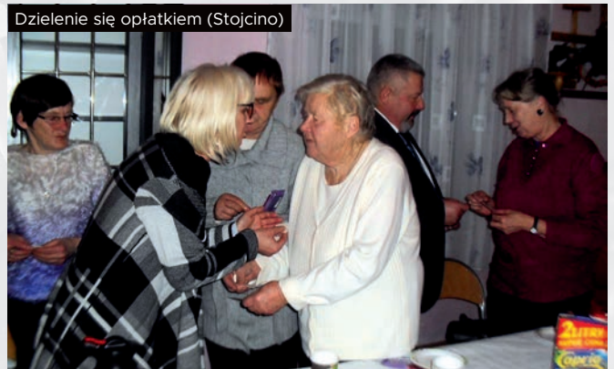
Dzielenie się opłatkiem (Stojcino)