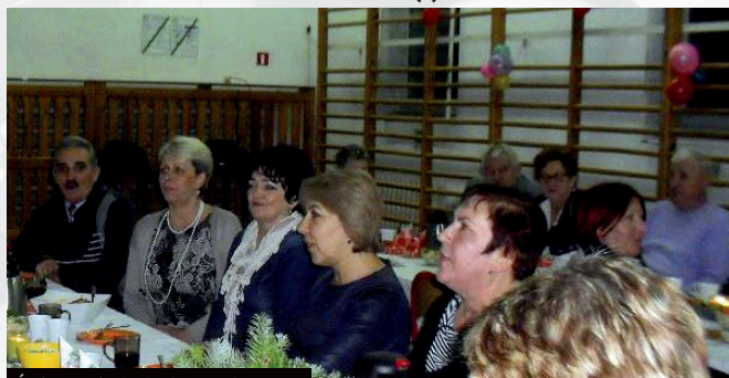
Śpiewanie kolęd (Gardna W.)