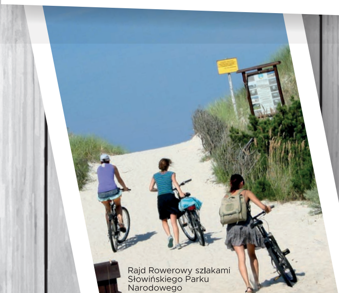
Rajd Rowerowy szlakami Słowińskiego Parku Narodowego