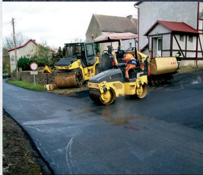
Prace drogowe na ul. Daszyńskiego i od strony zachodniej kościoła

Infrastruktura drogowa znalazła się w centrum zainteresowania samorządowców. Można powiedzieć, że inwestycja przyniosła konkretne efekty. Przede wszystkim mieszkańcom żyje się łatwiej. Codzienna podróż nie jest gehenną, a wręcz staje się przyjemnością. Reasumując, wykonano nakładki asfaltowe na 14 odcinkach dróg gminnych o łącznej powierzchni około 15 tys. m 2 . Oprócz tego zakupiono około 400 ton kruszywa na łączną kwotę 26 tys. zł. pod utwardzenie nawierzchni drogowej, również tam gdzie nie była wykonywana nakładka. Łącznie na poprawę stanu dróg gminnych przeznaczono w budżecie gminy 1 mln złotych, co jest dużym osiągnięciem wobec niewielkiego budżetu Gminy. Samorząd Gminy ma na uwadze, że jest wiele dróg które wymagają poprawy, a które w obecnie planowanej inwestycji nie zostały uwzględnione. Takim odcinkiem jest między innymi droga prowadząca do ośrodka zdrowia w Smołdzinie, która wymaga dodatkowej pracy związanej z wykonaniem infrastruktury technicznej umożliwiającej odprowadzenie wód opadowych. - W 2018 roku planowane są dalsze inwestycje, również te prowadzone wspólnie ze Starostwem Powiatowym, to przede wszystkim droga do m. Siecie – mówił nam Wójt A. Walach. Inwestycje drogowe przyczynią się do poprawy bezpieczeństwa na drogach Gminy Smołdzino.