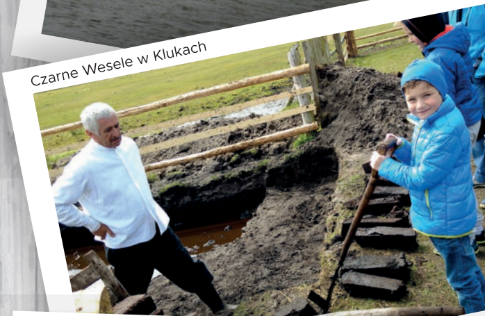
Czarne Wesele w Klukach