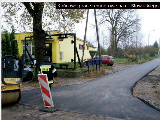
Końcowe prace remontowe na ul. Słowackiego

Tak jest w Smołdzinie, natomiast w Gardnie Wielkiej wyremontowano ulice: Słowackiego, Daszyńskiego, Pomorską, Ogońską. Są już plany kontynuacji remontów w roku 2018.